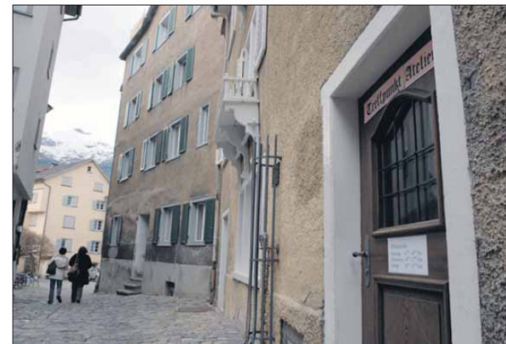
«Eine Oase der Mitmenschlichkeit.» Der Treffpunkt Atelier an der Sennhofstrasse 11 im Herzen der Churer Altstadt.