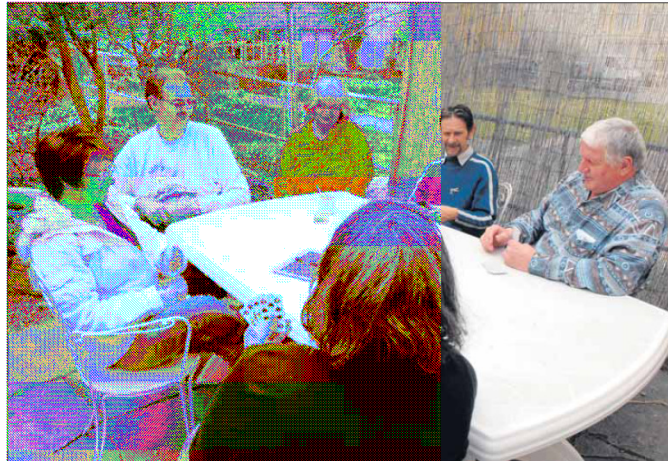
«Es ist ein bisschen wie in einer grossen Familie.» Benützer und Teammitglieder des Ateliers beim Jassen im Garten.