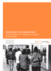
Datenschutz in der Sozialen Arbeit Eine Praxishilfe zum Umgang mit sensiblen Personendaten