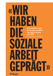
«Wir haben die Soziale Arbeit geprägt» Soziales Wirken in der Schweiz seit 1950 Zeitzeuginnen und Zeitzeugen erzählen