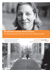
Berufskodex Soziale Arbeit Schweiz Ein Argumentarium für die Praxis der Professionellen