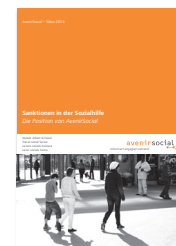
Diverse Positionspapiere: • Sanktionen in der Sozialhilfe • Das bedingungslose Grundeinkommen • Nein zur Besteuerung der Sozialhilfe • Übersicht über bildungs- politische Themen und Positionen von AvenirSocial • Integrationsprogramme in der Sozialhilfe