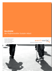
Berufsbild der Professionellen Sozialer Arbeit

Weitere Informationen finden Sie unter www.avenirsocial.ch oder per Telefon 031 380 83 00.