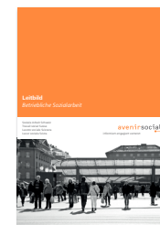
Leitbild Betriebliche Sozialarbeit